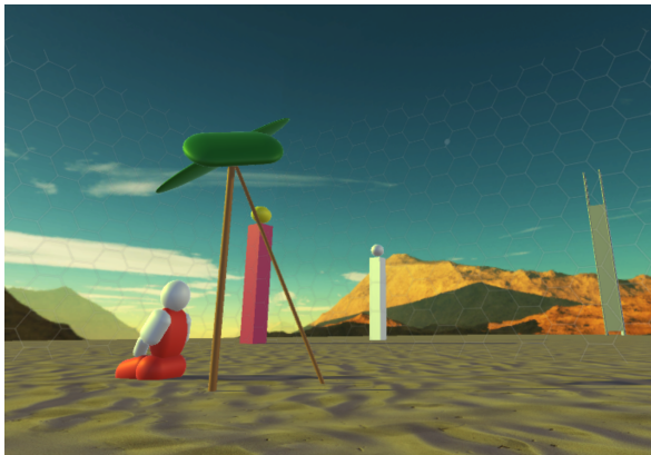
Figure 2 : 청동기 시대 좌표 (0,0)의 청색기 구획에서 커뮤니티에 의해 만들어진 구조물들

우리는 decentraland.org/world에서 세계 최초의 뷰어를 열었습니다. 모든 열정있는 유저들은 노드를 실행하고, 블록체인을 다운로드하고 검증할 수 있으며, 고급 설명서 8 를 참조하여 세계를 탐험할 수 있습니다.